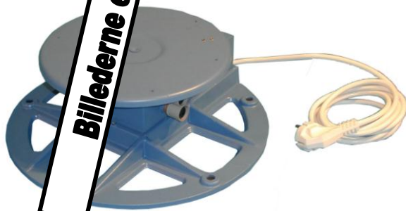
DB 100 FLT / FLTSK

Anvendelse: stående eller hængende Materiale: metal, m. 2 meter ledning Bæreevne: max 50 kg Dimension: ø250x85mm Vægt: 2,30 kg Hastighed: 3 omgang i minuttet Ekstra: strømudtag – 220v Pris: Spørg på dagspris. Max 50 kg centreret, ca. 15 kg i bevægelse.