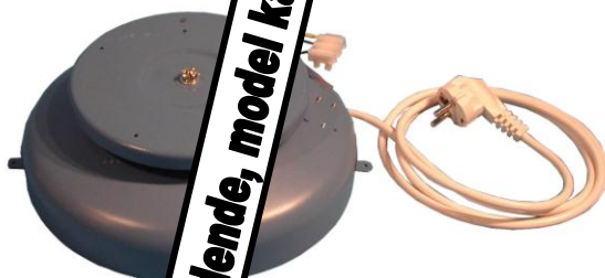
DB 50 FLTSK

Anvendelse: stående Materiale: lakeret kunststof, m. 2 meter ledning Bæreevne: max 20 kg Dimension: ø180x70mm Vægt: 0,78 kg Hastighed: 2½ omgang i minuttet Ekstra: strømudtag – 220v Pris: Spørg på dagspris. Max 20 kg centreret, ca. 6 kg i bevægelse.